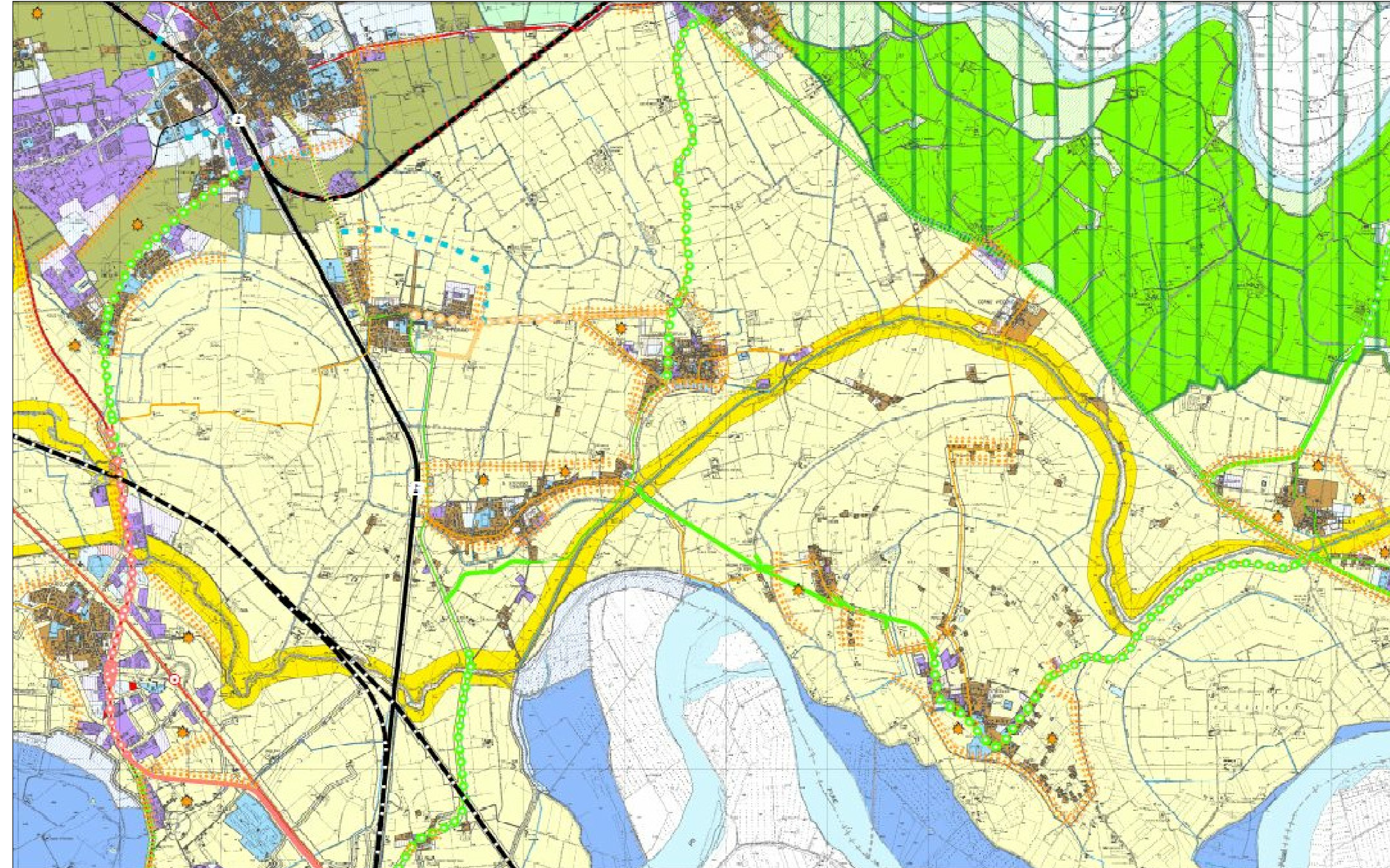
Tavola delle indicazioni di piano Tav. 2.2.c - Sistema rurale