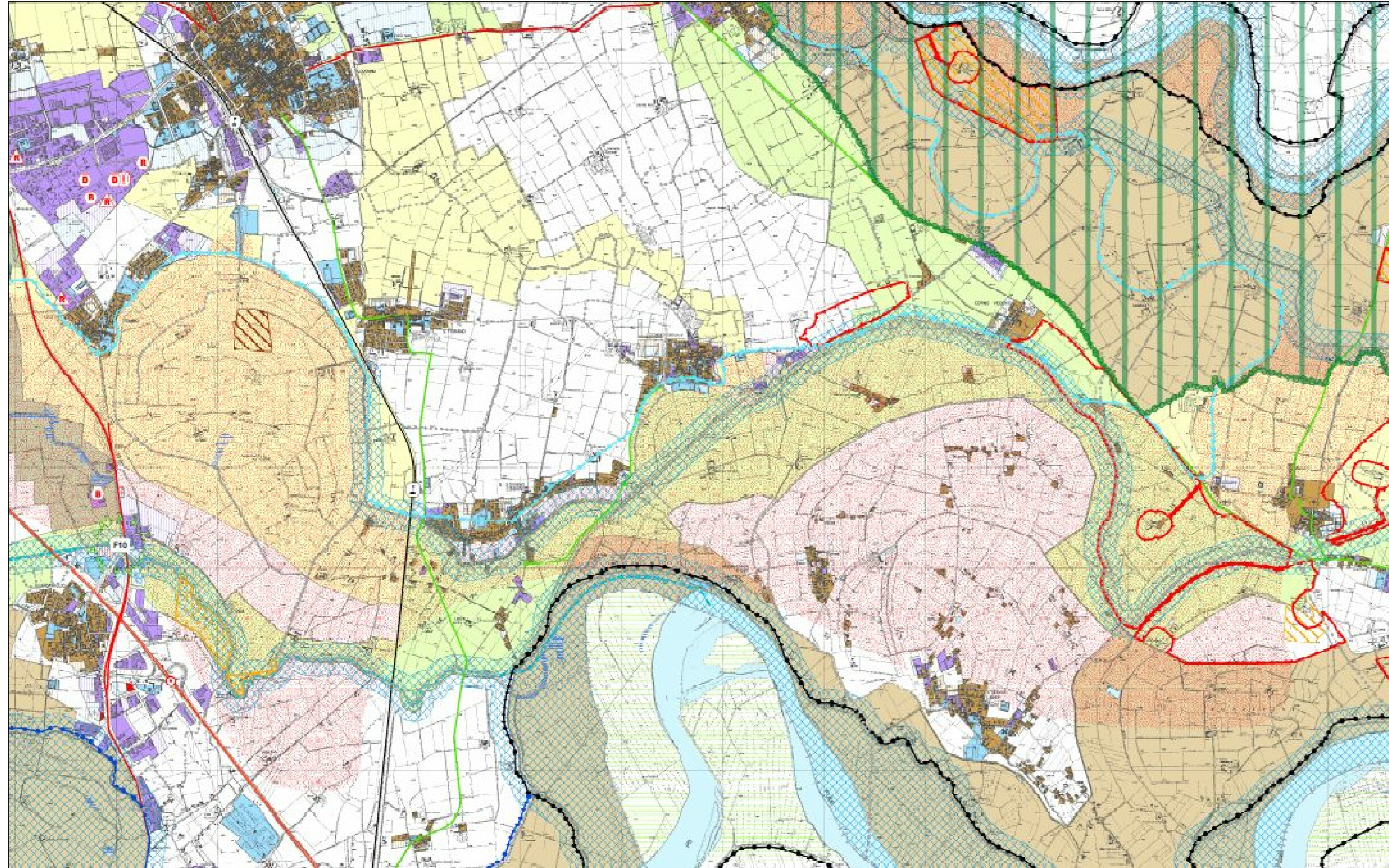
Tavola delle indicazioni di piano Tav. 2.1.c - Sistema fisico naturale